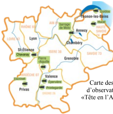
Carte des sites d'observation de «Tête en l'Air» 2007

Soutien financier de l'opération « Tête en l'Air »